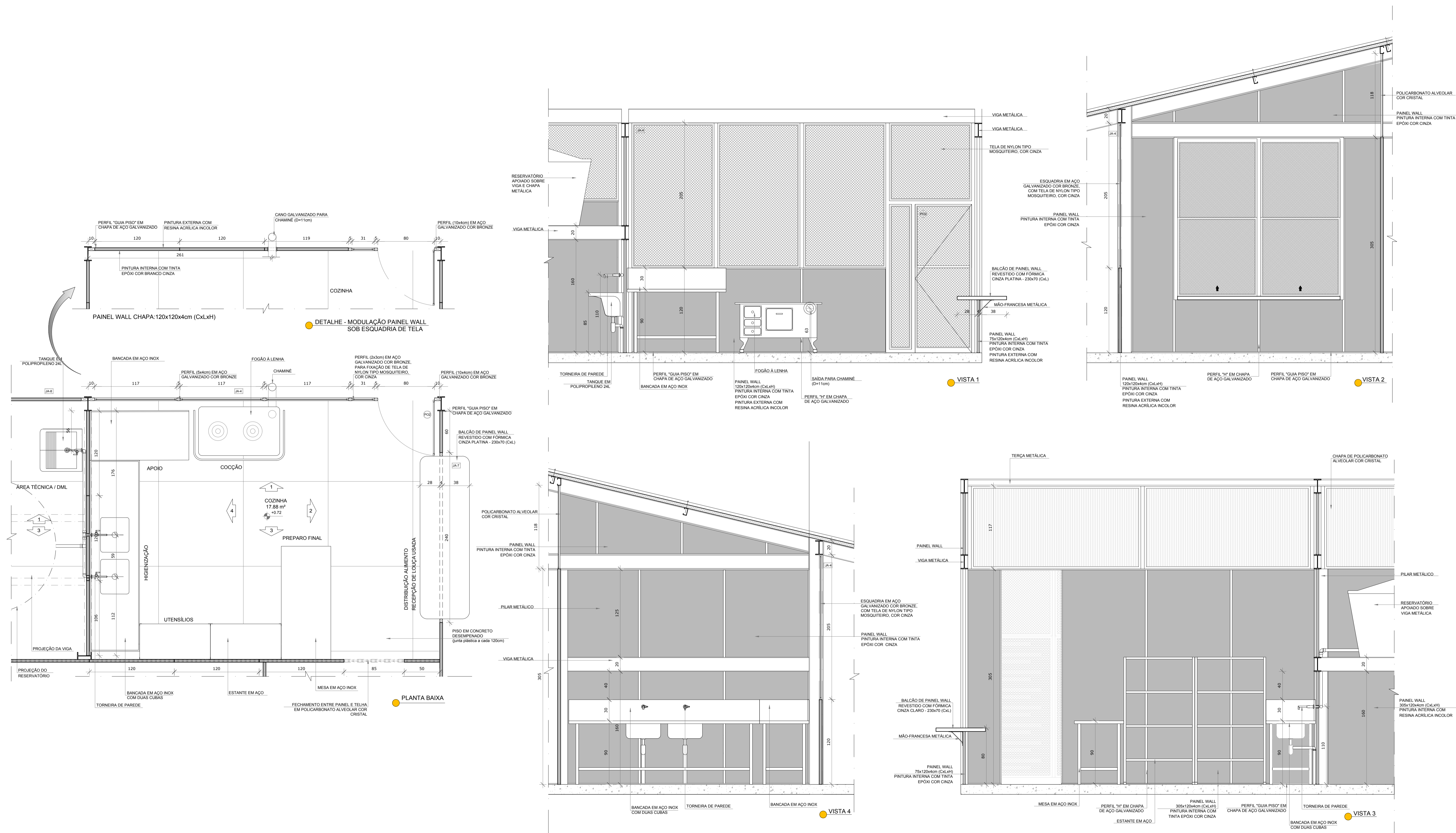
CROQUI DE REFERÊNCIA